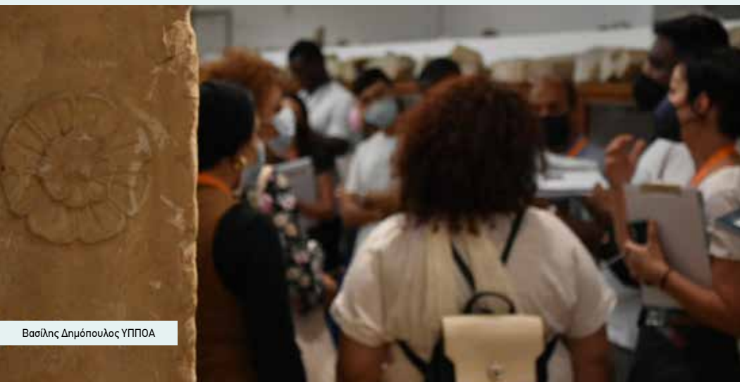
Βασίλης Δημόπουλος ΥΠΠΟΑ

Τα μνημεία και τα μουσεία αποτελούν το έναυσμα για έναν δημόσιο διάλογο που προάγει τη διαπολιτισμική κουλτούρα και αναδεικνύει τον πολιτισμό ως κοινό τόπο συνάντησης και τρόπο εμπλουτισμού της ανθρώπινης ύπαρξης και συνύπαρξης. Κεντρικός στόχος της εκπαιδευτικής διαδικασίας είναι οι «διαπολιτισμικοί περιηγητές/τριες» να εκφράσουν αξίες, βιώματα και συναισθήματα που είναι πανανθρώπινα και οικουμενικά και να συνομιλήσουν για αυτά με το κοινό τους μέσα στα μουσεία και τους αρχαιολογικούς χώρους.