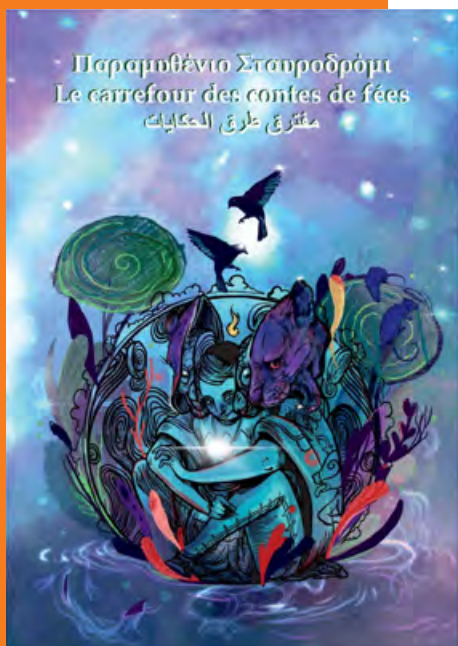
Εξώφυλλο παραμυθιού “Παραμυθένιο Σταυροδρόμι”

“Εύχομαι διαβάζοντας το «Παραμυθένιο Σταυροδρόμι» να νιώσουμε ξανά παιδιά και να μπορέσουμε να δούμε τον κόσμο με καθαρό βλέμμα και ενσυναίσθηση”