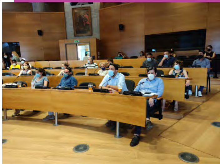
Συζήτηση με πρόσφυγες την Παγκόσμια Ημέρα Προσφύγων με πρωτοβουλία του ΣΕΜΠ Θεσσαλονίκης, Ιούνιος 2021.

Η εκδήλωση πραγματοποιήθηκε με χρηματοδότηση της Ύπατης Αρμοστείας του ΟΗΕ για τους Πρόσφυγες και του Διεθνούς Οργανισμού Μετανάστευσης.