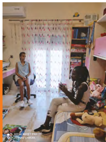
Στιγμιότυπα από το ντοκιμαντέρ «Καρενέ»

Με παρόμοια βίντεο θα συμμετάσχουν και άλλες ευρωπαϊκές δημόσιες τηλεοράσεις, αλλά και η Ιαπωνία. Στο τέλος του έτους, τα ντοκιμαντέρ αυτά θα γίνουν οι κρίκοι ενός διακρατικού μωσαϊκού με επίκεντρο την παιδική ηλικία και θα παρουσιαστούν σε ειδική εκδήλωση στη Γενεύη.