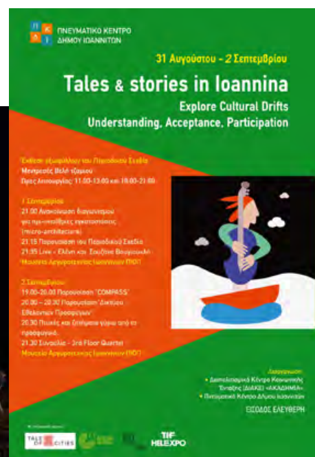
Πολυθεματικό Φεστιβάλ Tales & Stories in Ioannina που διοργάνωσε το Διαπολιτισμικό Κέντρο "Ακαδημία" σε συνεργασία με άλλους φορείς, Σεπτέμβριος 2021.