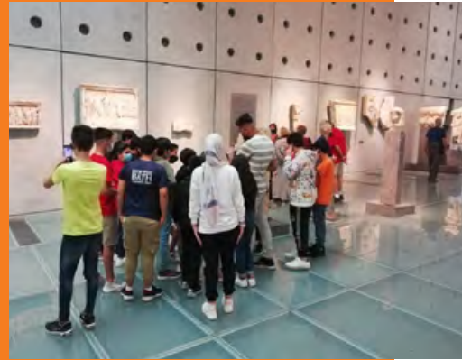
Επίσκεψη στο Μουσείο της Ακρόπολης

Στόχος της επίσκεψης, με βάση το κοινό ευρωπαϊκό θέμα του φετινού εορτασμού «Κληρονομιά ανοιχτή σε όλους», ήταν να δοθεί η ευκαιρία τόσο στα παιδιά όσο και στο Μουσείο Ακρόπολης να συμμετάσχουν σε μια γόνιμη συνάντηση, που θα συμβάλει στην εξοικείωση των παιδιών με την ιστορία και τον πολιτισμό της χώρας και την προώθηση της κοινωνικοποίησης και της κοινωνικής τους ένταξης.